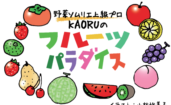
イラスト：小林裕美子